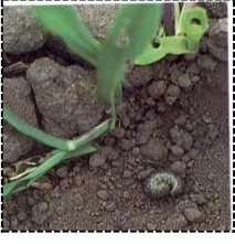
চিত্র ৪. কাটুই পোকা আক্রান্ত গাছ।