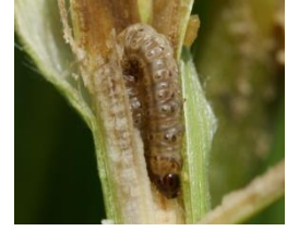
চিত্র ৭. ডগা ও কান্ড ছিদ্রকারী পোকা

দমন ব্যবস্থা: কাটুই পোকা দমনের জন্য ভোর বেলা কাটা চারা গাছের গোড়া খুড়ে কীড়াগুলো মেরে ফেলতে হবে। তাছাড়া হালকা সেচ দিলে মাটির নীচে লুকিয়ে থাকা কীড়া মাটির উপরে আসবে, ফলে সহজে পাখি এদের ধরে খাবে বা হাত দ্বারা মেরে ফেলা যাবে। এছাড়া প্রতি লিটার পানির সাথে ৫ মি.লি. কীটনাশক (ডার্সবান ২০ ইসি বা পাইরিফস ২০ ইসি) মিশিয়ে গাছের গোড়ায় চার দিকে বিকাল বেলায় ভালভাবে স্প্রে করে দিতে হয়। আবার পাতা খেকো লেদা পোকা দ্বারা আক্রান্ত গাছে প্রতি লিটার পানির সাথে ১ গ্রাম কীটনাশক (প্রোরোক্লোইন ৫ এসজি বা ইমাকর ৫ এসজি) মিশিয়ে গাছের উপরিভাগ ভালভাবে স্প্রে করে ভিজিয়ে দিতে হবে। জাব পোকা দমনের জন্য প্রতি লিটার সাথে ৫ গ্রাম ডিটারজেন্ট বা সাবানের গুড়া মিশ্রিত করে আক্রান্ত গাছে প্রয়োগ করতে হবে। এছাড়া প্রতি লিটার পানির সাথে বায়োনিম ১ ইসি বা ফাইটোম্যাক্স ৩ ইসি (১ মি.লি.) অথবা মেলাডান ৫৭ ইসি (২ মি.লি.) হারে ভালভাবে মিশিয়ে আক্রান্ত গাছে স্প্রে করে জাব পোকা দমন করা যায়। ডগা ও কান্ড ছিদ্রকারী পোকা দমনের জন্য ফুরাডান ৫ জি প্রতি হেক্টরে ২০ কেজি হারে অথবা ৩/৪ টি দানা প্রতি গাছের উপরিভাগে এমন ভাবে প্রয়োগ করতে হয় যেন দানাগুলো কান্ড এবং পাতার মাঝে থাকে। চারা অবস্থায় ফেরোমন ফাঁদ ১০ বর্গ মিটার দূরত্বে স্থাপন করে এ পোকা দমন করা যায়। আক্রান্ত মাঠ বায়ো কীটনাশক যেমন স্পিনোসেড প্রতি ১০ লিটার পানিতে ৪ মি.লি. হারে মিশিয়ে স্প্রে করতে হবে। এছাড়া প্রতি লিটার পানিতে ২ মি.লি. মার্শাল ২০ ইসি অথবা ডায়াজিনন ৬০ ইসি ভালোভাবে মিশিয়ে স্প্রে করলে এই পোকা দমন করা যায়।