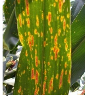
চিত্র ৩. পাতার দাগ রোগে আক্রান্ত ভুট্টা গাছ।

দমন ব্যবস্থা: টিল্ট ২৫০ ইসি ছত্রাকনাশক অথবা ফলিকিউর প্রতি লিটার পানিতে ০.৫ মি.লি. হারে মিশিয়ে ১৫ দিন অন্তর ৪ বার গাছ ভিজিয়ে স্প্রে করলে পাতা ঝলসানো, শীথ ব্লাইট বা পাতার খোল ঝলসানো এবং পাতার দাগ রোগ দমন করা যায়।