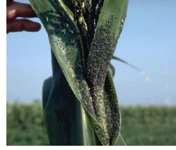
চিত্র ৬. জাব পোকা আক্রান্ত গাছ