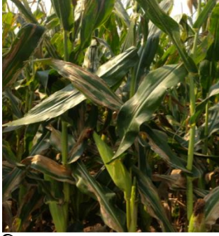
চিত্র ২. পাতা ঝলসানো রোগে আক্রান্ত ভুট্টা গাছ।

রোগবালাই: ভুট্টার উল্লেখযোগ্য রোগের মধ্যে লিফ ব্লাইট বা পাতা ঝলসানো, শীথ ব্লাইট বা পাতার খোল ঝলসানো এবং লিফ স্পট বা পাতার দাগ রোগ বাংলাদেশে কম বেশি লক্ষ্য করা যায়।