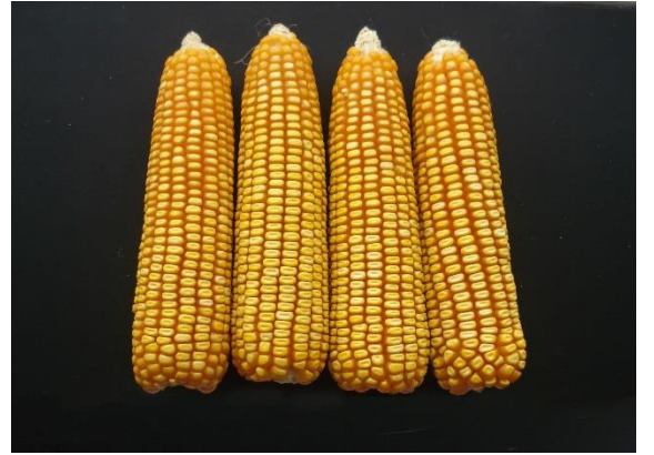
চিত্র ১. বারি হাইব্রিড ভুট্টা -৯

মাড়াইয়ের সময় : মোচা খড়ের রং ধারণ করলে ও পাতা কিছুটা হলদে হয়ে এলে বুঝতে হবে মোচা সংগ্রহের সময় হয়েছে। মোচা থেকে ছাড়ানো দানার গোড়ায় কালো দাগ দেখা দিলে মোচাগুলো গাছ